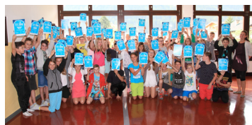
Alle Teilnehmer der NMS Vorderes Stubai am BIKEline-Projekt 2016

Die BIKEline ist ein österreichweiter Fahrradwettbewerb für SchülerInnen ab der 5. Schulstufe. Mit dem Fahrrad zurückgelegte Schulwege werden mittels Helm-Chip elektronisch erfasst und als virtuelle Reise um die Welt dargestellt. An vielen Orten der Reise gibt es attraktive Überraschungspreise zu gewinnen. Die fleißigsten WeltumradlerInnen werden mit den